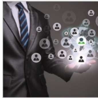
CENTRE D' ACTIONS CRM