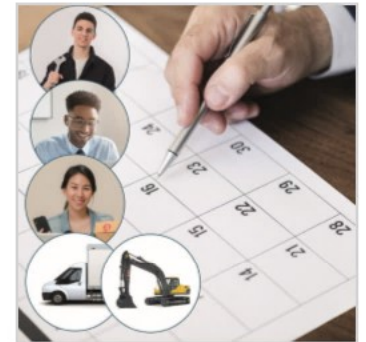
PLANNING DES RESSOURCES